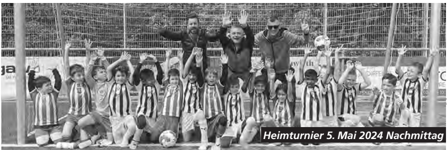
Heimturnier 5. Mai 2024 Nachmittag

Mitte November wurde das Training in der Halle fortgesetzt. Wie schon die letzten Jahre konnten wir im Winter wieder die Kinder in drei Gruppen an drei Trainingseinheiten in zwei verschiedenen Hallen der Schulhäuser Zelgli und Blumenfeld halten. Die Investition der Gemeinde in den Kunstrasen zeigt Wirkung, dass für die Kleinen mehr Hallenzeiten zur Verfügung stehen. Einzig die Weihnachtsferien verliefen ohne Training, ansonsten konnten wir alle anderen 49 Wochen mit den Kindern arbeiten. In der Halle konnte der Fokus vermehrt auf die Grundformen der Bewegung gelegt werden.