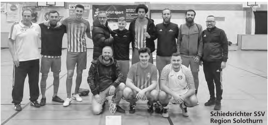
Schiedsrichter SSV Region Solothurn