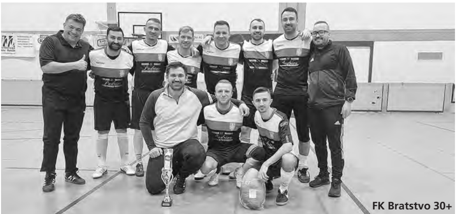
FK Bratstvo 30+