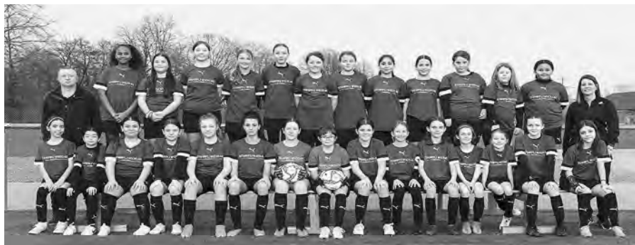
Mit sportlichen Grüssen: Euer Selmon

Mit dem Blick auf eine vielversprechende Zukunft danke ich allen für Euer unermüdliches Engagement.