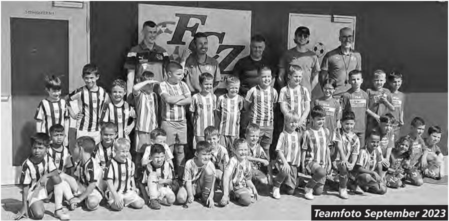
Teamfoto September 2023

Für die Saison 2023/24 mussten wir für die Jun. F das Trainerteam verstärken. Glücklicherweise haben sich zwei Väter von Kindern unserer Junioren gemeldet.