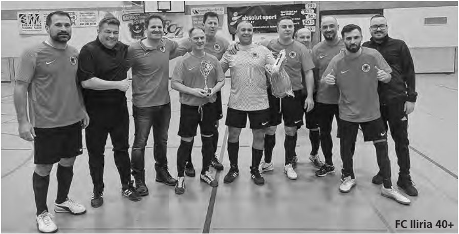
FC Iliria 40+